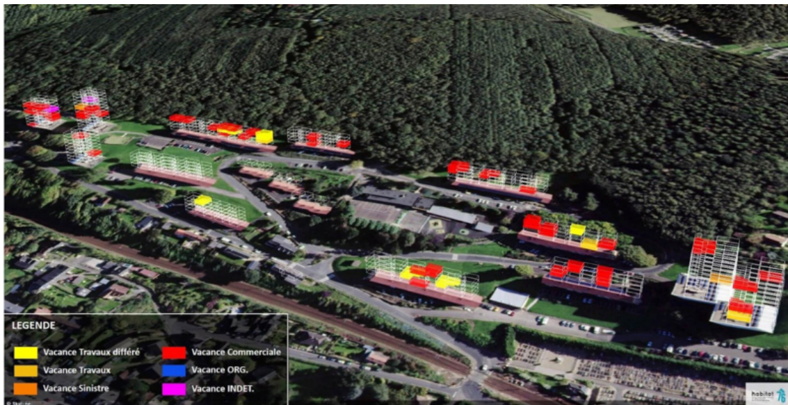
Figure 3 : Outil Territoires 3D